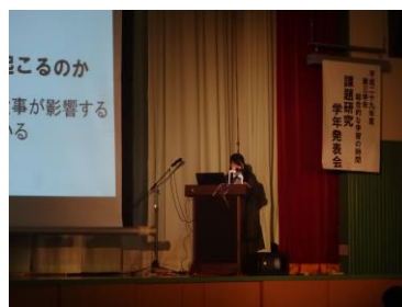
【今年度の3年課題研究 学年発表会】