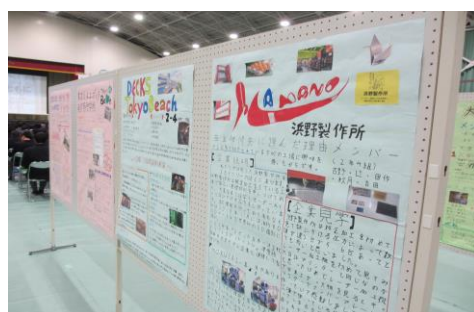
【昨年度の展示の様子】