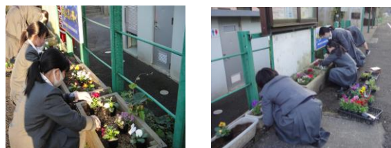
パンジー-花言葉「think of me (私を思って)」

佐々町役場の産業振興課様からのご依頼により、11月9日(月)と10日(火)にMR清峰高校前駅に設置してあるプランターの苗の植え替え作業を家庭クラブ委員7名が行いました。今回は「パンジー」です。MRを利用される方々の癒しになって頂ければ幸いです。